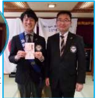
飯坂 RC よりお饒別 新天地でもご活躍を!