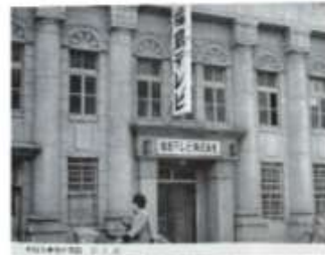
福島県社会福祉会館(大町東町新庁内)