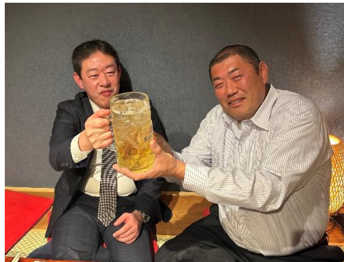
美味しい料理にお酒も進みます！