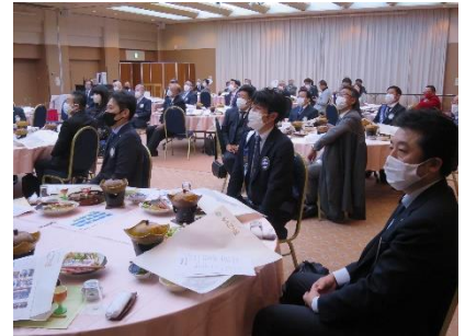
◆閉会点鐘 会長エレクト