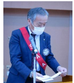
スマイリング報告