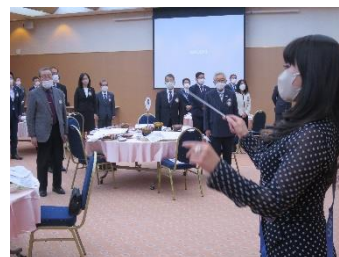
ロータリーソング