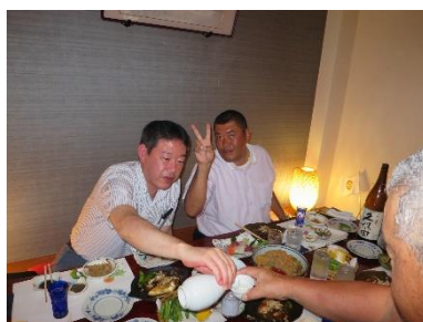
「お疲れさまでした！」