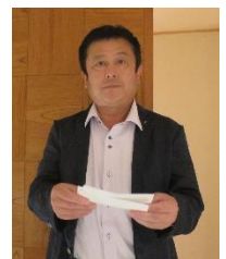
スマイリング報告