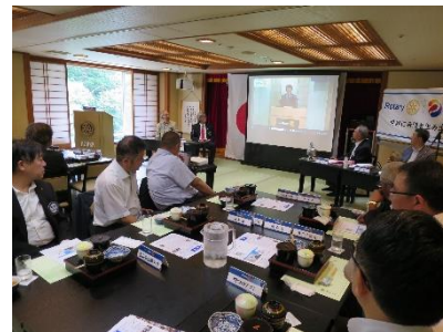
右近ガバナーからのビデオメッセージを見る会員